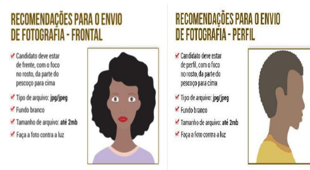
IMAGEM 4 – PROTÓTIPOS PARA ENVIO DE FOTOGRAFIAS